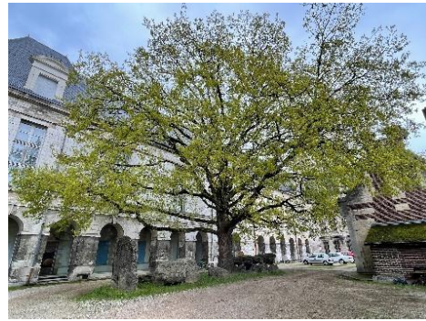
A Troyes, au musée Saint-Loup, un chêne d'une envergure exceptionnelle.