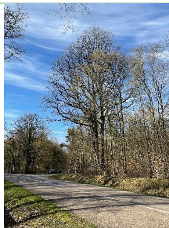
Près de la maison du parc, un magnifique chêne à 2 troncs .

Rédaction : Emmanuelle ROUX Président : Joël GILBERT