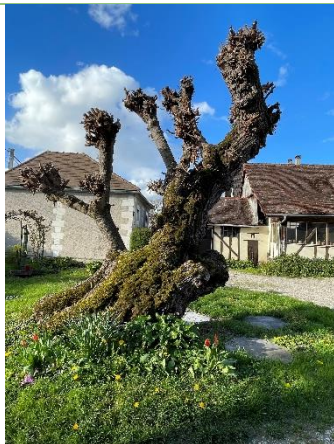
A Sainte-Maure, un mûrier dans une propriété privée.