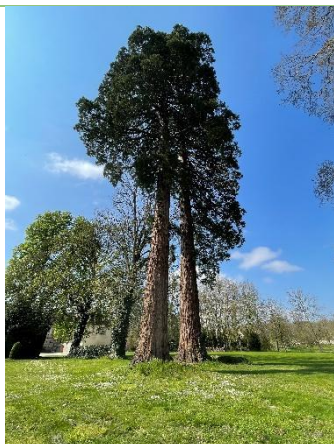
Le parc du Paraclet avec 2 magnifiques séquoias .