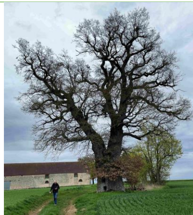
A Jully-sur-Sarce, un chêne d'un âge très avancé ( nous recherchons son propriétaire et son âge ).