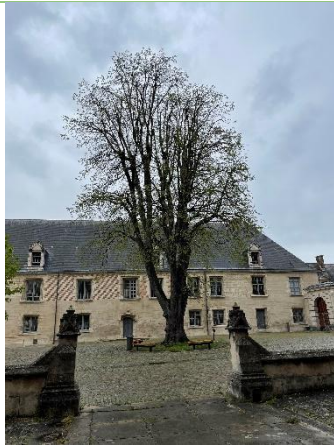
A Troyes, au musée d'art moderne, un tilleul originaire du Vatican.